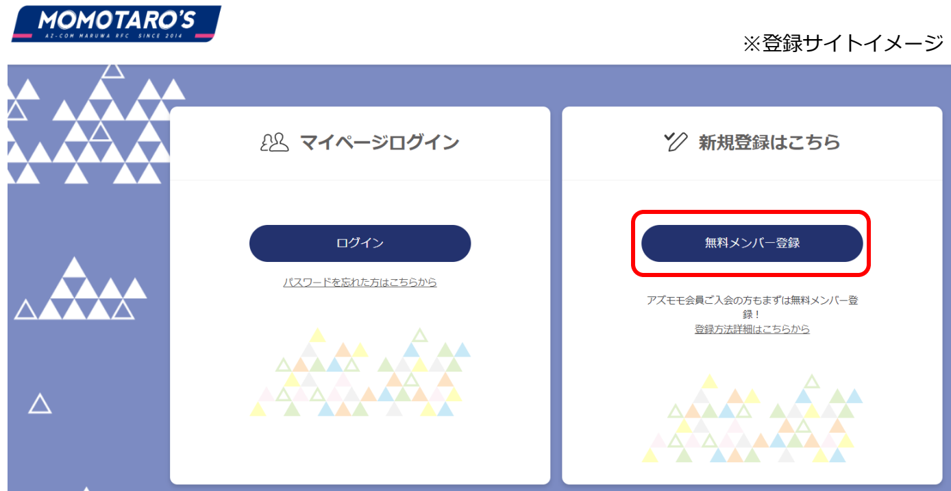
※登録サイトイメージ

下記のURLをクリックしてAZ-COM丸和MOMOTARO'Sファンクラブ登録サイトへお進みいただき、「無料メンバー登録」をクリックしてください。 《 ファンクラブ登録サイトは こちら 》